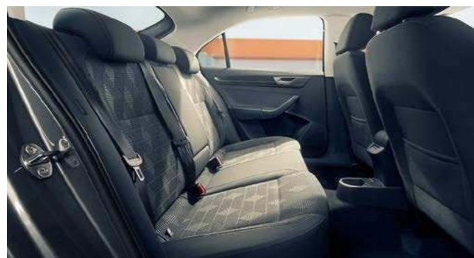
Подогрев задних сидений

Объем багажного отделения до 530 литров с возможностью трансформации салона и увеличения грузового пространства до 1460 литров